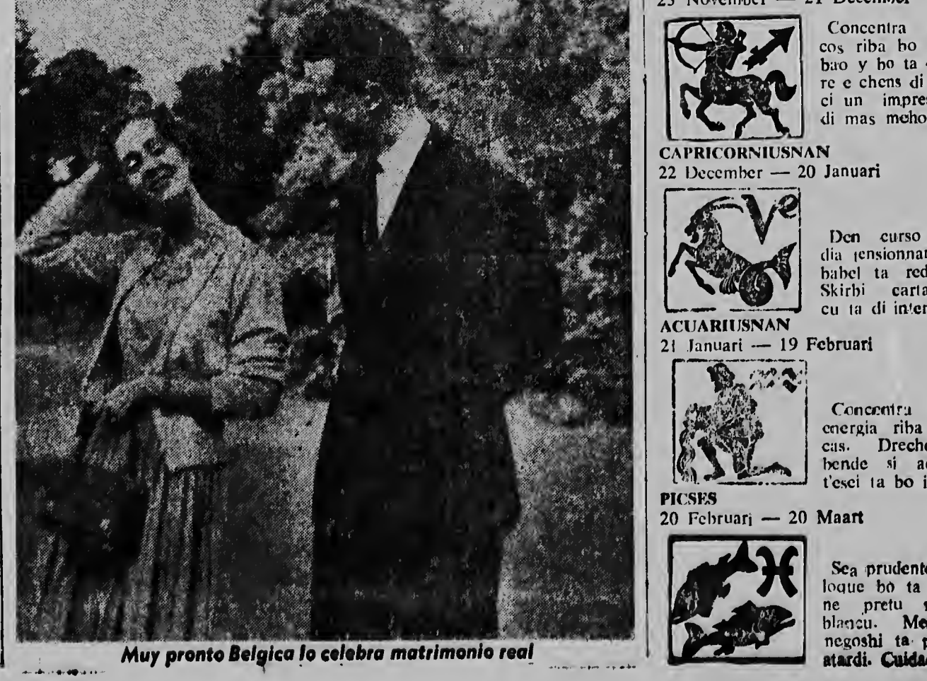
Muy pronto Belgica lo celebra matrimonio real